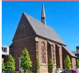
19:30 Uhr Agneskapelle