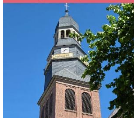
20:00 Uhr Liebfrauenkirche