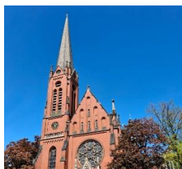
19:00 Uhr Christuskirche